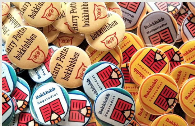
På Lidingö har alla bokklubbar sin egen pin.