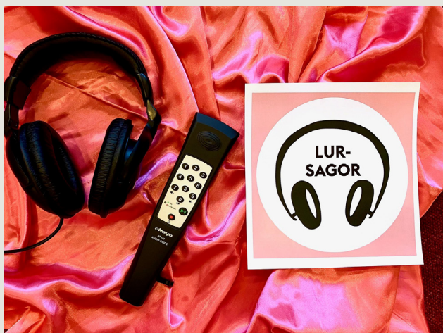
Lursagor i Rinkeby